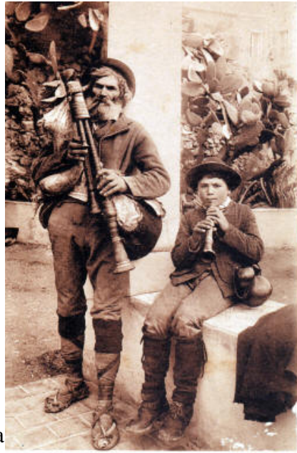
Caormina - Pifferi - (Costumi Siciliani)