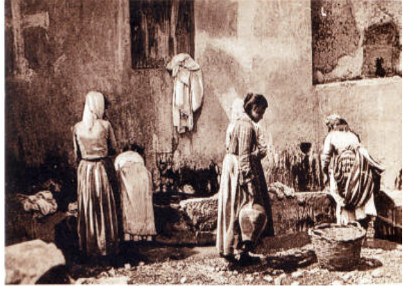
TAORMINA - Costumi Siciliani

‘N ‘mienzu di carni ed ughna amara cu ci ancugna.” Nei litigi tra parenti stretti è meglio non intromettersi, prima o poi faranno pace.